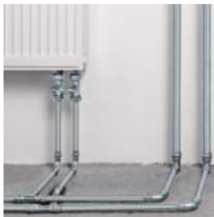
Prestabo je raznovrsnost u instalaciji grijanja.