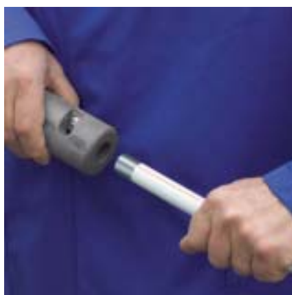
Viega alat za skidanje bijelog vanjskog plašta cijevi sustava Prestabo.

Za primjenu sustava Prestabo Viega je razvila radni pribor koji jamči najveću udobnost i veliku sigurnost: s alatom za skidanje plašta odstranjujete bijeli PP-plašt cijevi za nadžbukne instalacije, a sa Viega alatima za prešanje u nekoliko sekundi stvarate sigurne spojeve.