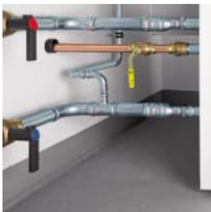
Priključak kotla za grijanje: polazni i povratni vod sa sustavom Prestabo i kuglastim slavinama Easytop. Priključak plina sa sustavom Profipress G.