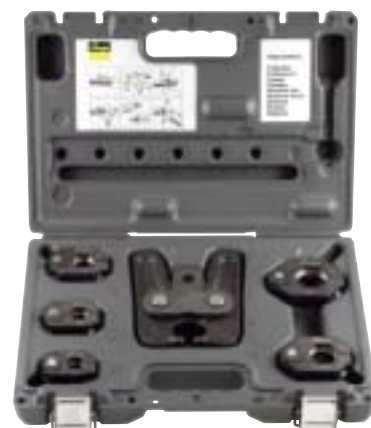
Za veličine 15 – 35 mm: zglobna čeljust za prešanje sa patentiranom zglobnom funkcijom i pet steznih prstenova.